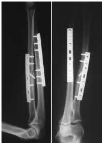
جاناندازی باز و تثبیت با پلاک در فرد بالغ

در صورتیکه شکستگی استخوان های ساعد جابجایی داشته باشند در بچه ها سعی در جاناندازی بسته شکستگی میشود. در صورتیکه شکستگی جافتاد درمان بصورت گچ گیری به صورتی است که ذکر شد. در صورتیکه جاناندازی بسته موفقیت آمیز نباشد درمان بصورت عمل جراحی خواهد بود.